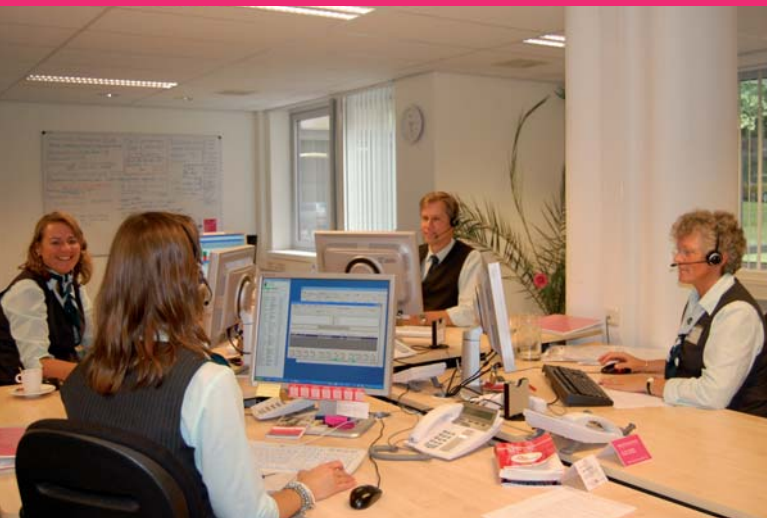
Medewerkers van de DCM-telefooncentrale die gehuisvest is in locatie Baarn